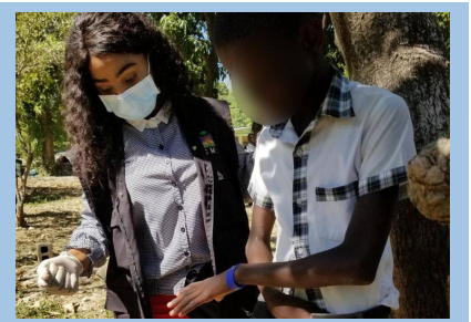
Le MSPP a déployé des cliniques mobiles dans les communes de l'Ouest (à gauche) et a visité des écoles dans la commune de Tabo (à droite) dans le cadre des efforts visant à enrayer la maladie grattaie des griffes de chat (lymphogranulome bénin) à travers Haïti.