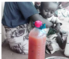
Eau dite «buvable» dans la zone

Province : Tuléar Région : Atsimo andrefana District : Tuléar II Commune rurale : Andranohinaly