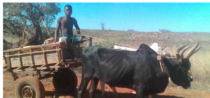
Mode de transport d'eau