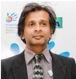
Conseiller Task Force

Responsable des projets RSE pour la protection de l'environnement aussi bien en interne qu'en externe. Là où DHL utilise son cœur de métier, le transport. « Manzer Partazer » de l'entreprise sociale ZeroHero, DHL transporte les denrées alimentaires en surplus des fournisseurs et supermarchés directement et à zéro coût aux orphelinats partenaires en ville. « Trashure », la valorisation artisanale des déchets. DHL soutient les artisans locaux qui se lancent dans la protection environnementale afin qu'ils puissent exporter leur produits écoresponsable plus facilement et rejoindre le marché internationale (2018).